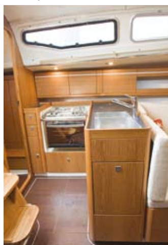
TO VASKER: Dehlers bysse er dypere.