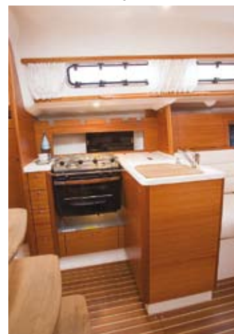
FLERE SKUFFER: X-yachts har fem skuffer.