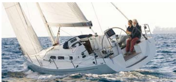
X-34 er ikke litt mer tur enn Dehler. Høy kjøp prosent gjør den trygg.