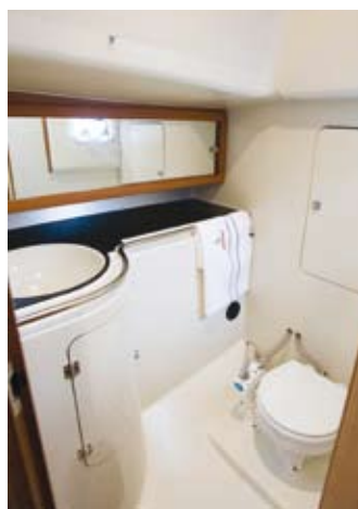
BAD i DEHLER 34: God plass, men klønete å åpne vindu.