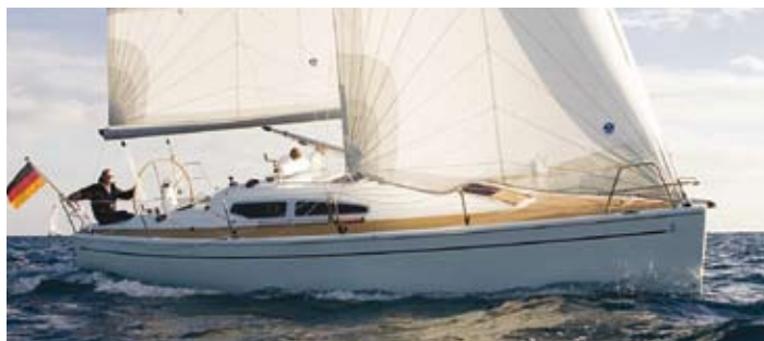
Dehler 34 kan også leveres i en IRC optimalisert utgave.