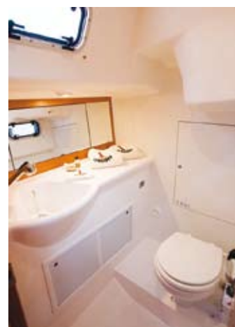
BAD X-34: Fremoverrettet toalett er bra i sjøen. Flott med skap for vått tøy.