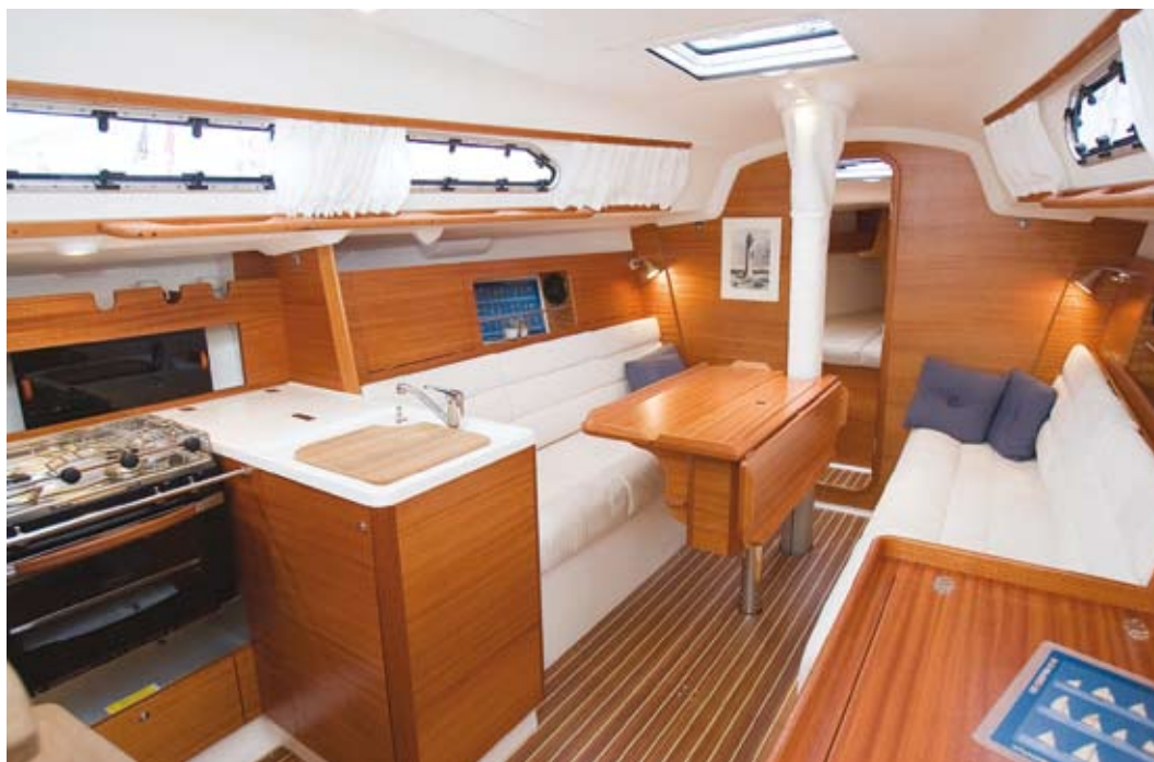
TIDLØS: X-Yachts kjører videre på sin elegante og konservative stil. En stil som sannynligvis ikke går av moten med det første.

Dehler 34 har masten plassert i forkant, og dypere overskap for bøker og utstyr. Dehlervertet har valgt mattlakkert teak i interiøret, med aluminiumsdekor på skap og dørker. Prismen i taket sørger for lys i salongen. Da er X-34 vesentlig lysere med hvit plast i køyefrontene, hvitt innertak og takluke over bordet.