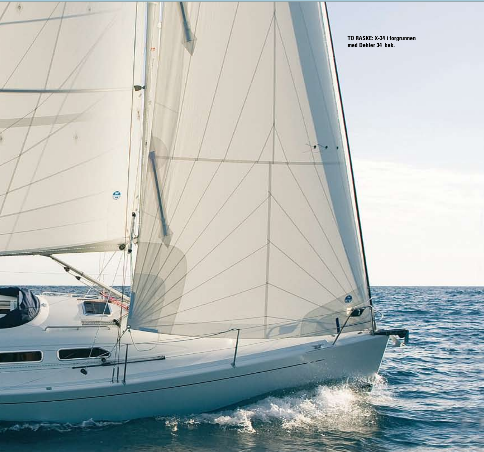
TO RASKE: X-34 i forgrunnen med Dehler 34 bak.