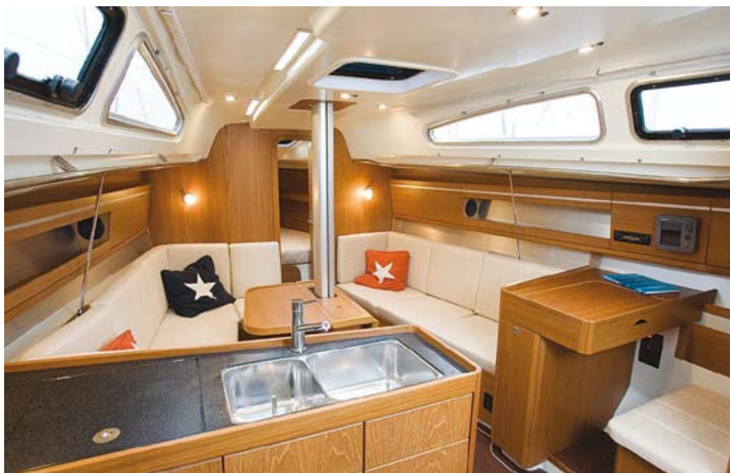
LYSERE: Dehler 34 er mer moderne under dekk og har smarte lysprismer i taket. Her er det også en U-salong.