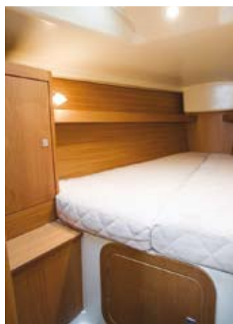
DEHLER 34: Forpiggen har tykke madrasser og god benplass.

ende og begge ga fin følelse av fart. Til tross for at forstaget på Dehler 34 som vi seilte i Barcelona etter sigende var for kort i forhold til tegningen, balanserte båten bra og begge oppnådde god høyde, selv i havdønninger og lett vind. Med høyere mast og lett kjøler er ventelig Dehler 34 mindre stabil når det blåser.